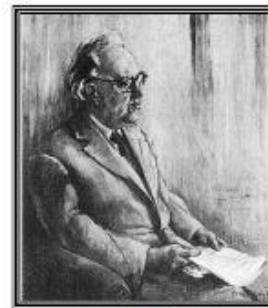
Ehrenbürger von Hultrop und Hamm